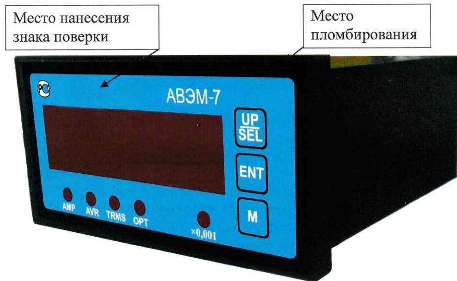
Рисунок 1 – Общий вид прибора измерительного АВЭМ-7 и схема пломбировки от несанкционированного доступа

Общий вид приборов представлен на рисунках 1 – 4. Схема пломбировки от несанкционированного доступа, обозначение места нанесения знака поверки представлены на рисунке 1.