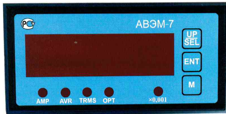
Рисунок 2 – Общий вид передней панели прибора измерительного АВЭМ-7