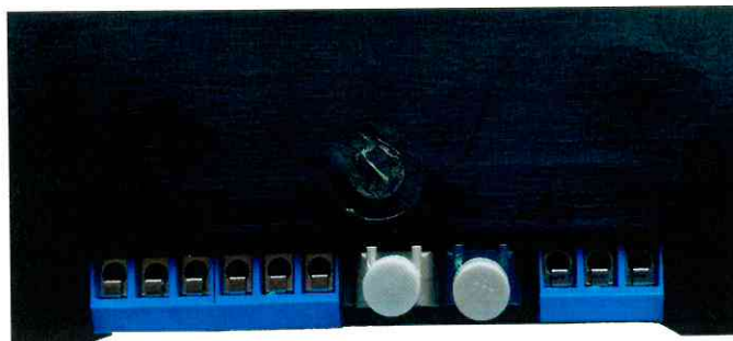
Рисунок 4 – Общий вид задней панели прибора измерительного АВЭМ-7 в исполнении с оптоволоконной линией связи